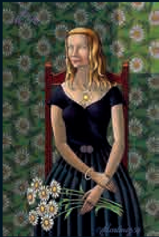
MRC with marguerites (1957)