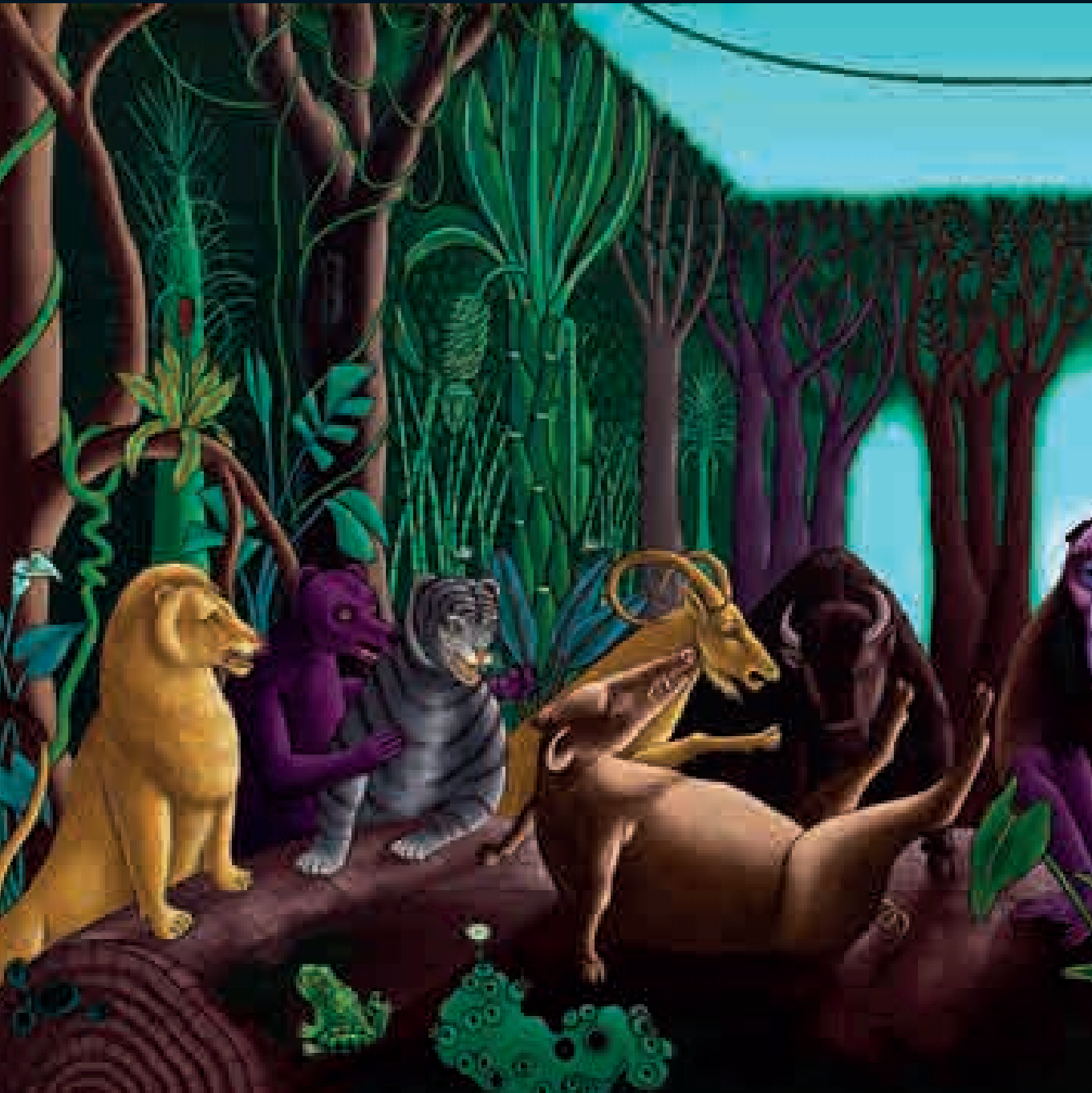
The Jungle Symposium III-5 (1960-69)