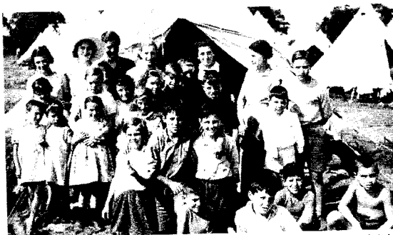
Varios de los menores que estuvieron en el campamento de Eastleigh.

El viaje duró dos días. Dos largas jornadas de mareas y hacinamiento (el buque tenía cabida para 800 pasajeros y transportaba a 4.057) en las que acechaba la amenaza de ser avistados por un barco enemigo y en las que dormir se convirtió en