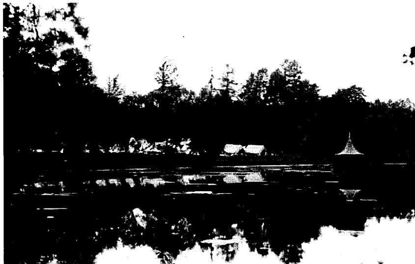
Imagen de una de las colonias de niños exiliados en Gran Bretaña.