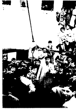
A bordo del barco.

corto. Para otros, largo. Y para el resto, eterno. Todos ellos, sin embargo, forman parte de la misma realidad. Siguen siendo hoy, setenta años después, los niños vascos del 37 . Los niños sobre los que su asociación, la que lleva su nombre, sigue indagando para recomponer aquel episodio histórico. Su trabajo ha dado hasta ahora muchos frutos. Quizás, su estancia estos días en Gipuzkoa permita obtener algunos más. De suceder, la visita habrá merecido más la pena. Pero, de no ocurrir, ésta habrá sido igualmente provechosa. Habrá servido, cuando menos, para dar a conocer un poco más de la historia de la Guerra, y, sobre todo, de la historia de Euskadi.