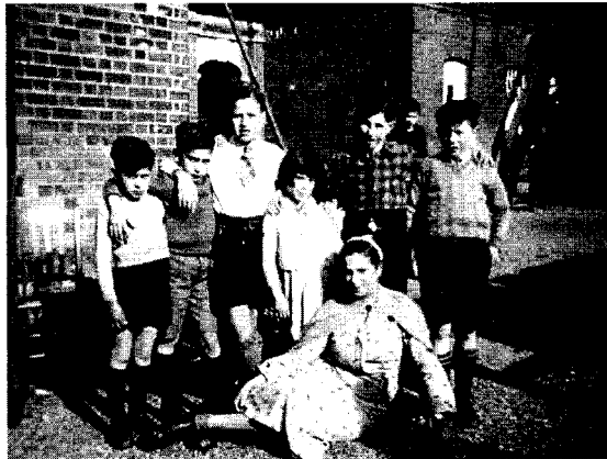
Un grupo de niños, durante su estancia en Inglaterra.

El barco, que superó en más de cuatro veces su capacidad de pasajeros, completó en dos días el viaje desde Santurtzi