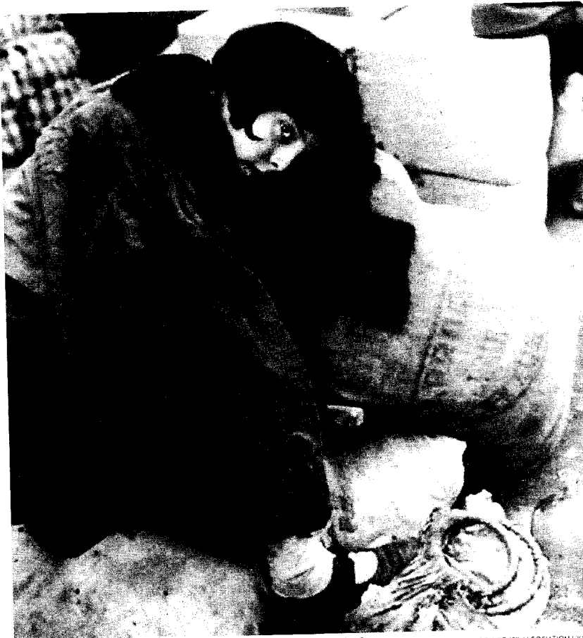
Imagen de la portada de un libro sobre el exilio de los niños en la Guerra.

Desde Inglaterra, la asociación Basque Children of '37 , que estos días está de visita por Gipuzkoa, lleva años trabajando para recoger y archivar todo el material vinculado a la presencia de niños vascos en aquel país. Es una labor de investigación que busca conocer y hacer saber lo que pasó, dónde pasó y cómo pasó. Porque, aunque es desconocido para muchos, el exilio inglés de la Guerra existió, fue importante y marcó para siempre las vidas de miles de vascos. Algunos volvieron pronto. Otros más tarde. Y otros nunca. Pero todos ellos tienen su espacio en el recuerdo y en la atención del citadino colectivo británico.